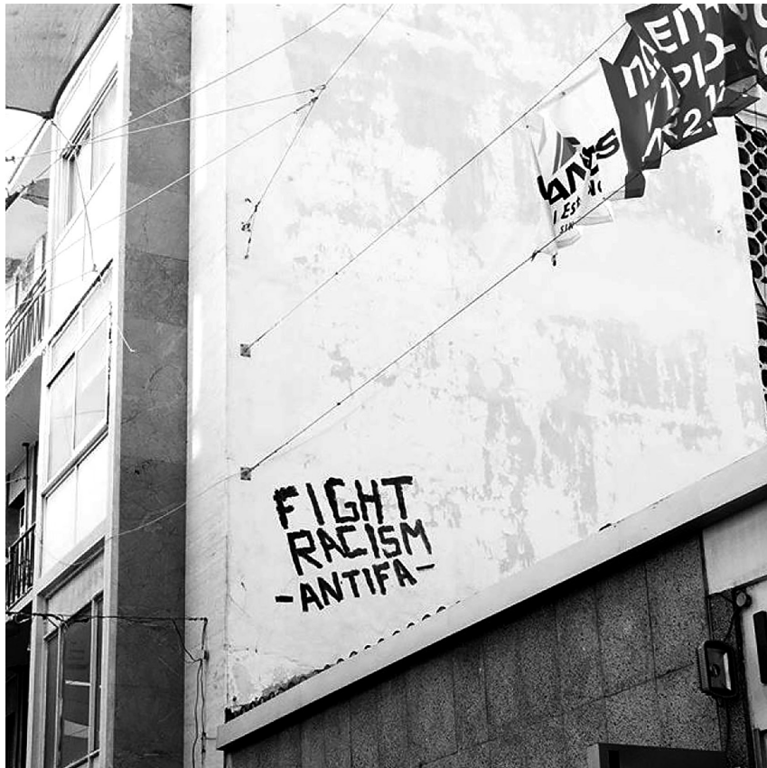
Οδός Λίδρας, 2014.