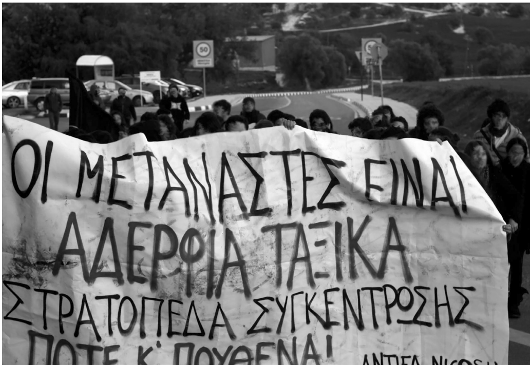
Διαδήλωση έξω από το κέντρο κράτησης μεταναστών στη Μενόγεια, 2014.