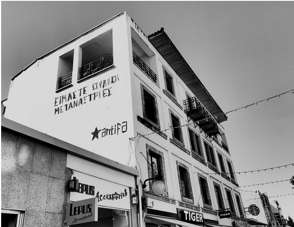
Είμαστε ούλλοι μετανάστριες. Οδός Λήδρας, 2014.