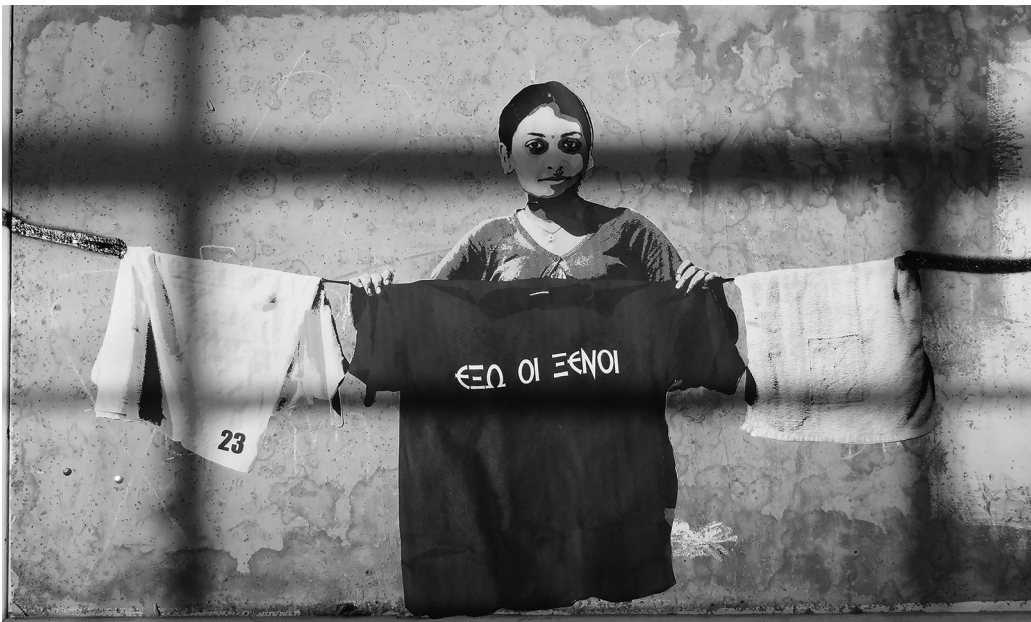
Wheat paste σε τοίχο, 2014.

Μια οικιακή εργάτρια κρεμάει άπλυτα. Μια μαύρη μπλούζα γράφει «έξω οι ξένοι».