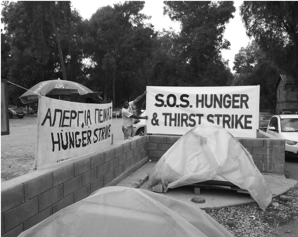
Αιτητές ασύλου σε απεργία πείνας έξω από το υπουργείο εσωτερικών, 2018.