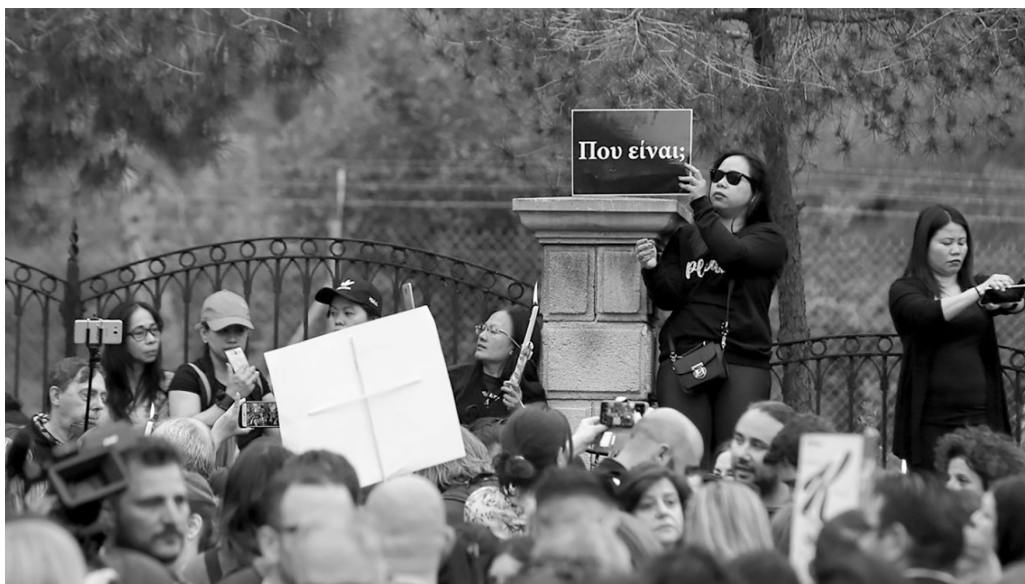
Διαδήλωση οικιακών εργατριών στο προεδρικό, Απρίλης 2019.