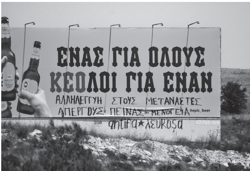
Σύνθημα αλληλεγγύης σε μετανάστες απεργούς πείνας, κρατούμενους στη Μενόγεια. Καλοκαίρι 2019.